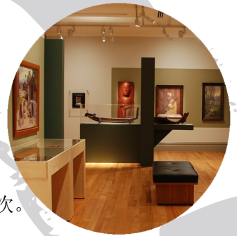
The Object of the Portrait. Rotorua Museum Te Whare Taonga o Te Arawa