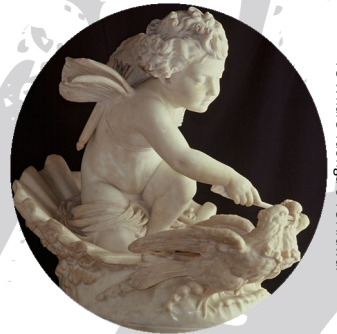
Of Summers: Cupid. Rotorua Museum Te Whare Taonga o Te Arawa.