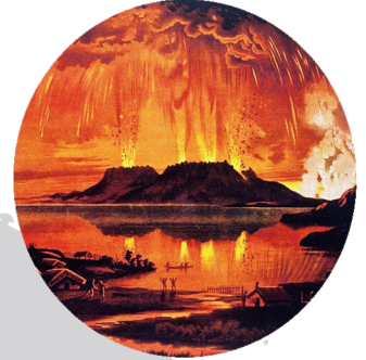
Mount Tarawera in eruption June 10 1886.

浴池咖啡厅有完整酒牌，出售可口的咖啡、面包片和蛋糕，还有多种新鲜三明治、包饼、意大利式三明治和简单膳食。