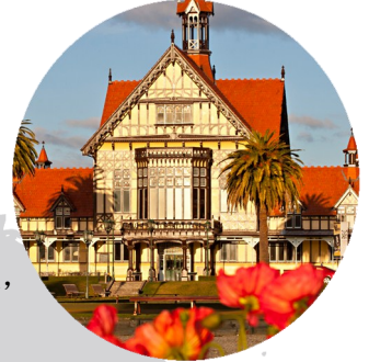
Rotorua Museum.

请浏览 www.rotoruumuseum.co.nz 网站，了解最新的展出信息。