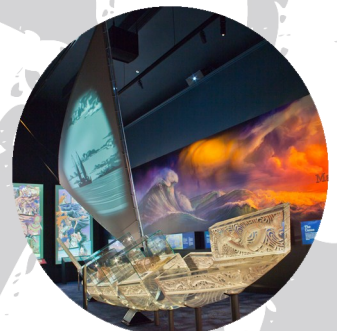
Waka. David Hamilton Photography. Rotorua Museum Te Whare Taonga o Te Arawa